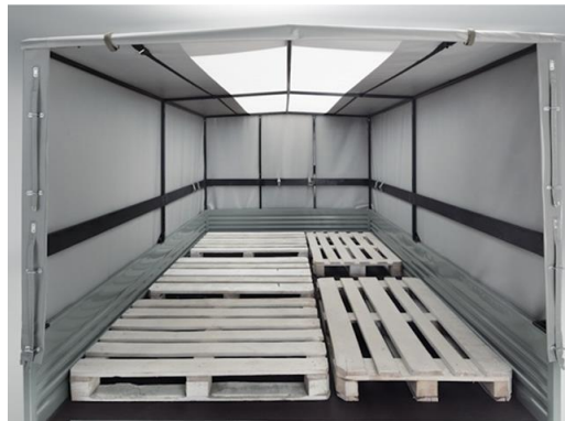
CABINA SIMPLE: CARROCERÍA