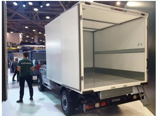
CABINA SIMPLE: FURGÓN - FURGÓN ISOTÉRMICO - FURGÓN FRIGORÍFICO