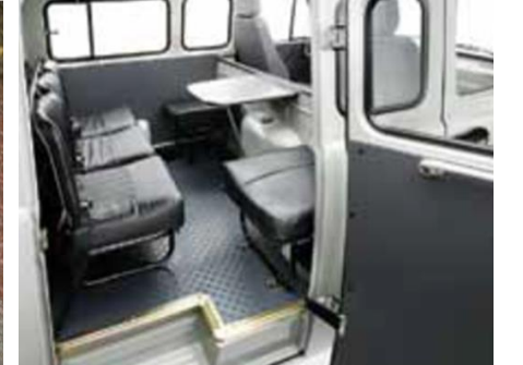
UAZ FURGÓN COMBI 4x4: 7 ASIENTOS + MESITA + COMPORTAMIENTO DE CARGA