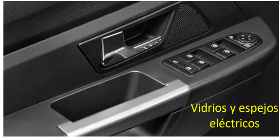
Vidrios y espejos eléctricos