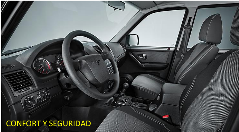
CONFORT Y SEGURIDAD