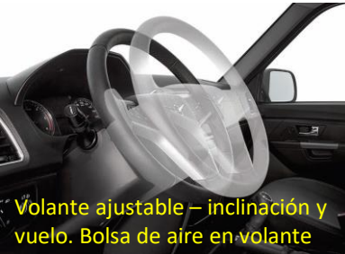
Volante ajustable – inclinación y vuelo. Bolsa de aire en volante