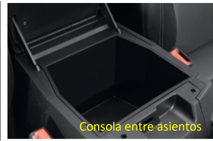
Consola entre asientos